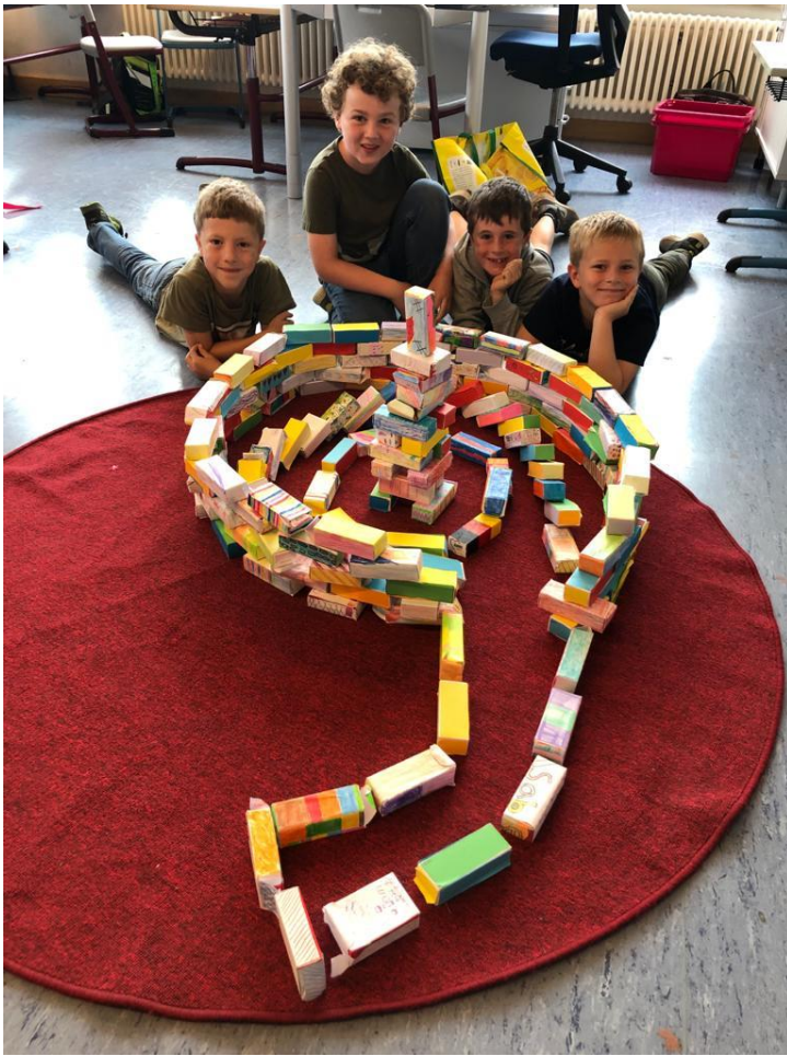
Platz 3: Klasse 4b – Brandenburger Tor und schiefer Turm von Pisa